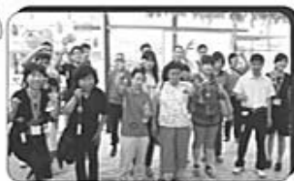
展現彩繪成果 各有巧思