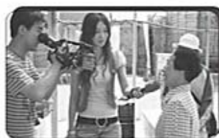
大苗栗新聞 現場採訪家屬