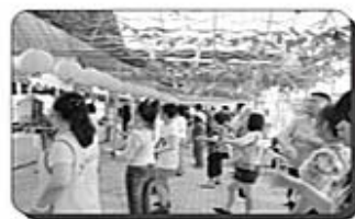
身心疲勞解放 ~妳是我的花朵~