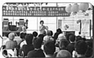
苗栗縣政府衛生局 黃科長秀蘭 蒞臨指導