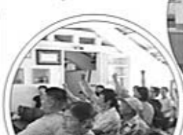
精神衛生法宣導 有獎徵答~踴躍發言