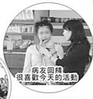
病友回饋 很喜歡今天的活動