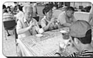
理事長帶領 大家動動手~風鈴彩繪