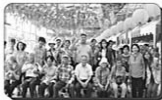
每件成品都很棒 ~大家都好開心~