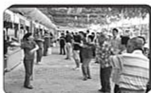
大家動一動 ~讚美操~