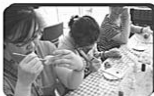
一起來畫 好玩的彩繪