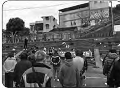
該下來集合活動一下囉!