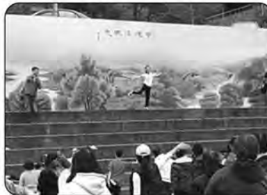
美麗的教練示範教導