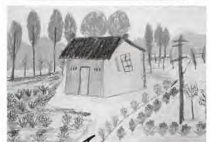
家園 三灣活泉學員