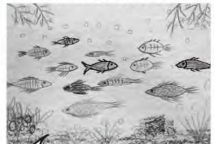
自由的魚兒 三灣活泉學員