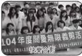
104年度關愛無限義剪活動 快樂合影