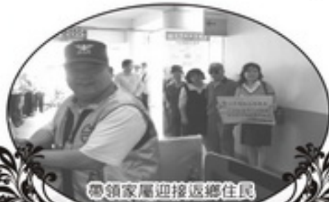
帶領家屬迎接返鄉住民