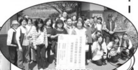
草山坊前合照留影