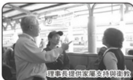
理事長提供家屬支持與衛教

看到此家人團聚時互相擁抱及興奮的情景，理事長及我都深受感動，更讓我們覺得，此行的支持與付出都是值得的，也決定未來繼續協助這樣有意義的活動，以服務苗栗地區精神障礙病友及家屬。