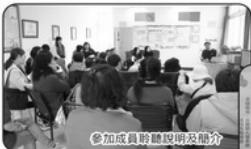
參加成員聆聽說明及簡介