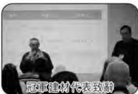
冠軍建材代表致辭