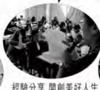
經驗分享_開創美好人生